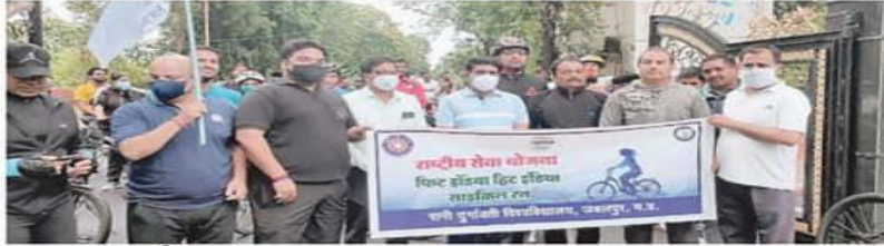
पद्मावती एक्सप्रेस, जबलपुर

भारत सरकार द्वारा चलाये जा रहे अभियान #Cycles4Change के अंतर्गत आज नगर निगम स्मार्ट सिटी जबलपुर एवं रानी दुर्गावती विश्वविद्यालय एनएसएस के संयुक्त तत्वावधान में फिट इंडिया फिट इंडिया टीम के अंतर्गत साइकिल ट्रेक रैली का आयोजन किया गया यह रैली रानी दुर्गावती विश्वविद्यालय से प्रारंभ होकर डुमना नेचर पार्क डुमना एवरपोर्ट रोड में समाप्त हुई, कार्यक्रम का मुख्य उद्देश्य शहर को साइकिल फ्रेंडली सिटी बनाना रहा।