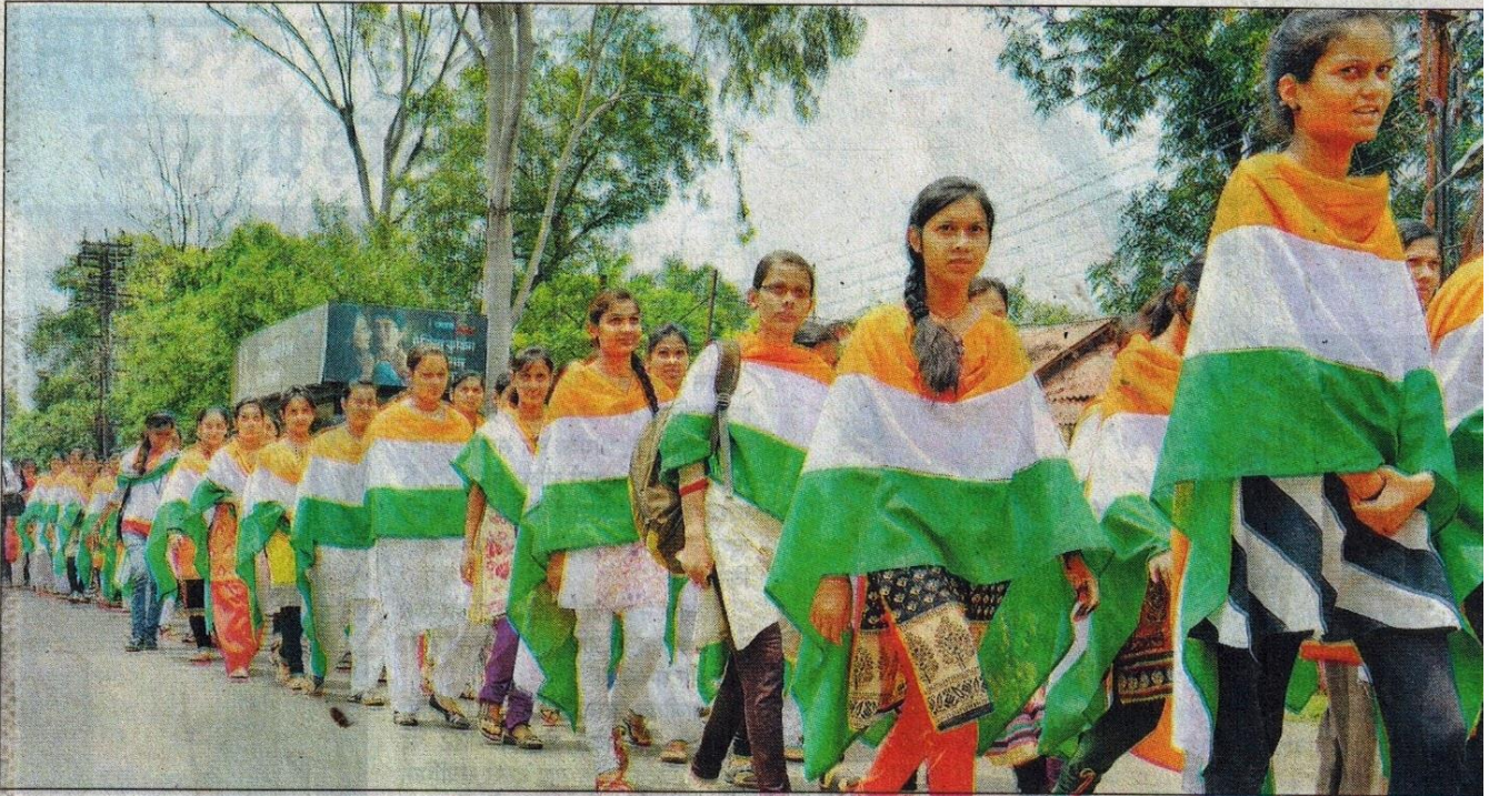
जबलपुर। आजादी की 70 वीं वर्षगांठ के उपलक्ष्य में सोमवार को होमसाइंस कॉलेज से छात्राओं ने तिरंगा रैली निकाली।