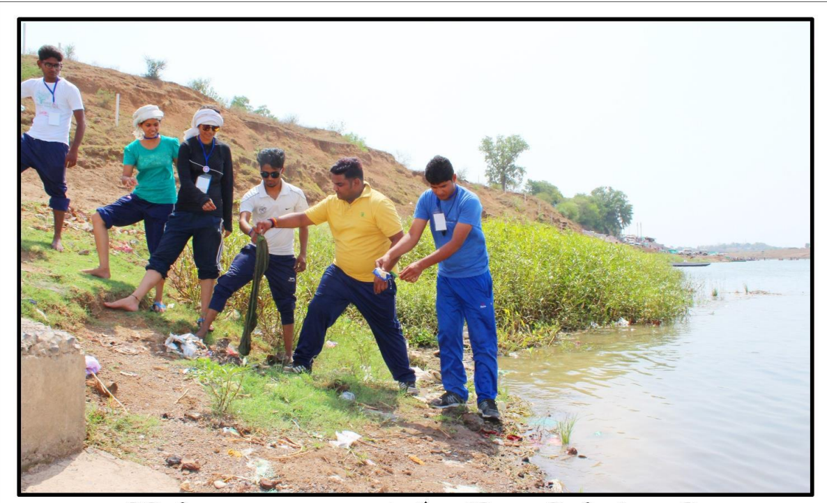
रादुविवि की एन.एस.एस. द्वारा सत्र 2017 में आयोजित 07 दिवसीय नेतृत्व प्रशिक्षण शिविर के दौरान ग्राम-बरमान में पर्यावरण संरक्षण कार्यक्रम के अंतर्गत नर्मदा घाट मे स्वच्छता कार्य के दौरान अधिकारी व स्वयंसेवक छात्र-छात्राएं