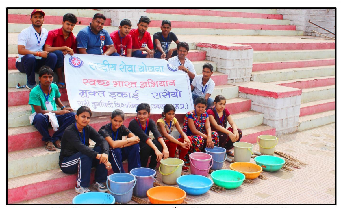
रादुविवि की एन.एस.एस. द्वारा सत्र २०१७ में आयोजित ०७ दिवसीय नेतृत्व प्रशिक्षण शिविर के दौरान ग्राम-बघुवार में पर्यावरण संरक्षण कार्यक्रम के अंतर्गत नर्मदाघाट मे स्वच्छता कार्य के दौरान अधिकारी व स्वयंसेवक छात्र