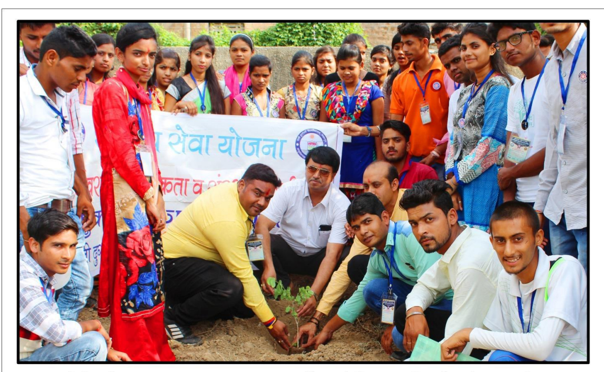
रादुविवि की एन.एस.एस. द्वारा सत्र 2018 में आयोजित 07 दिवसीय नेतृत्व प्रशिक्षण शिविर के दौरान ग्राम - बरमान में पौधारोपण करते अधिकारी व स्वयंसेवक छात्र