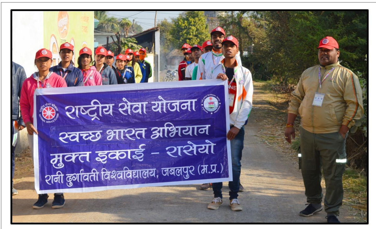
रादुविवि की एन.एस.एस. द्वारा सत्र 2019 में आयोजित 07 दिवसीय नेतृत्व प्रशिक्षण शिविर के दौरान ग्राम-बधुवार में स्वच्छ भारत जागरूकता रैली निकालते अधिकारी व स्वयंसेवक छात्र